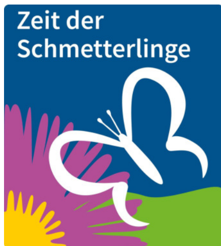
Logo: Zeit der Schmetterlinge

Der Fotowettbewerb findet parallel zur Zählaktion statt (15.06. bis 15.07.). Währenddessen vermitteln wir viel Wissenswertes (via Internetseite, Instagram, Facebook) - das Ziel: den Bürgern dieser Stadt einfache Handreichungen anzubieten, wie sie selbst auch mit wenig Mitteln etwas für Schmetterlinge (und andere Insekten) tun können, ob im Garten oder auf dem Balkon. Und nicht zuletzt möchten wir natürlich informieren über das Leben dieser faszinierenden kleinen Geschöpfe.